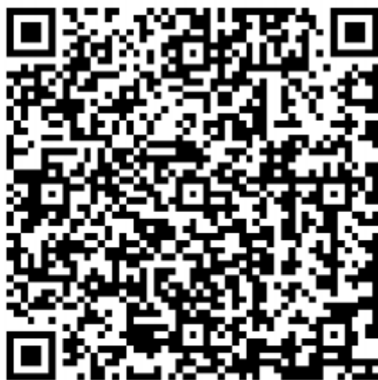
学生信息二维码生成器（正式）